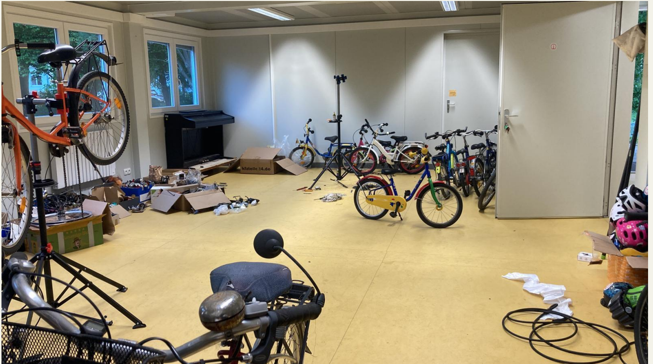
Abb. 5 Unsere Werkstatt im Mai 2025