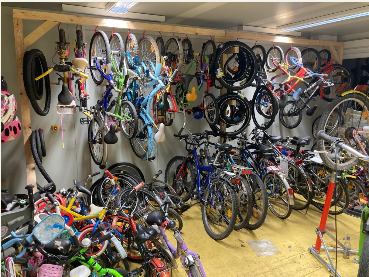
Abb. 6 Unsere Werkstatt im Februar 2026