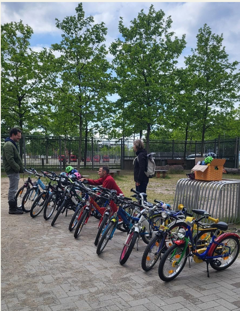
Abb. 2 Erste Übergabe an der neuen Grundschule Gröpelingen im Mai 2025