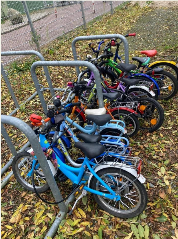
Abb. 7: Fertige KiTa- Fahrräder – bereit zur Abholung