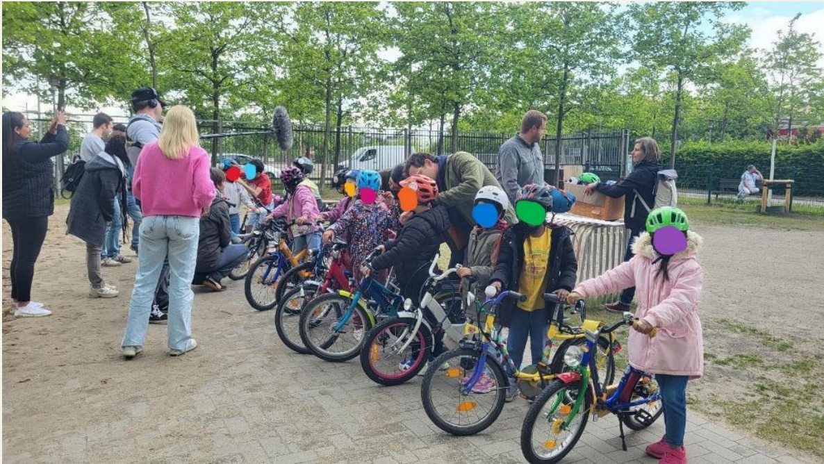
Abb. 3 Erste Übergabe an der neuen Grundschule Gröpelingen im Mai 2025, auf dem Bild sind zu sehen: das Team von Buten un Binnen, Eltern, Lehrende und Ehrenamtliche unseres Vereins und natürlich die Kinder.